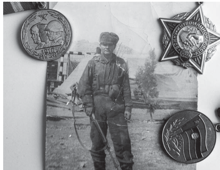
Март 1983 г., город Герат, ДРА