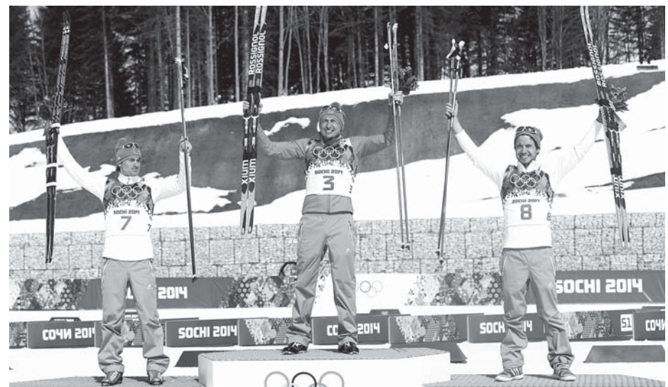
Наши призеры лыжного марафона (слева направо): Максим Вылегжанин (серебро), Александр Легков (золото), Илья Черноусов (бронза).