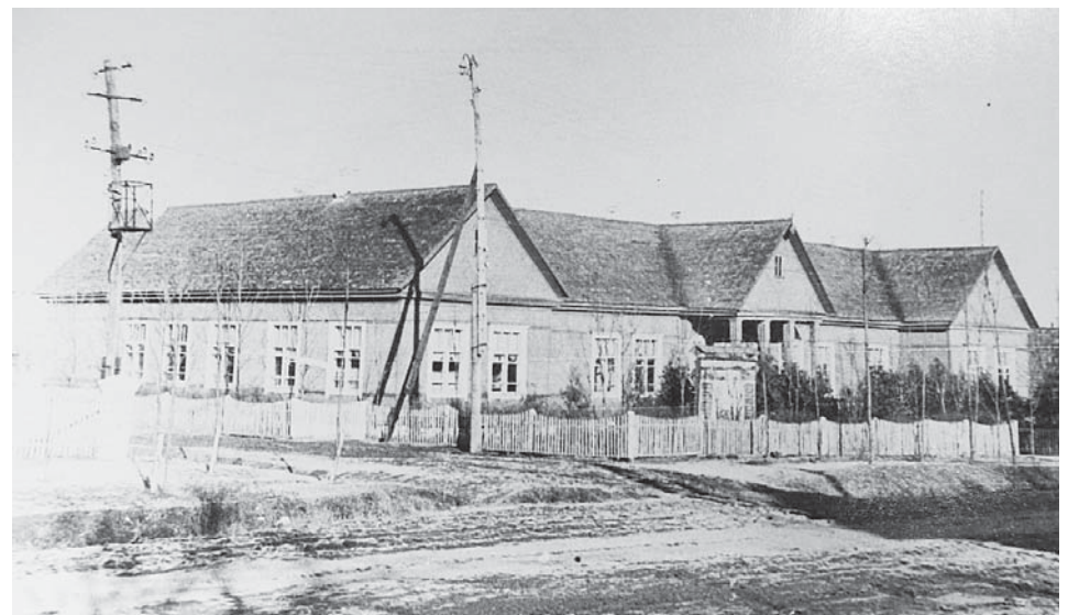
Здание РК КПСС, 1977 год