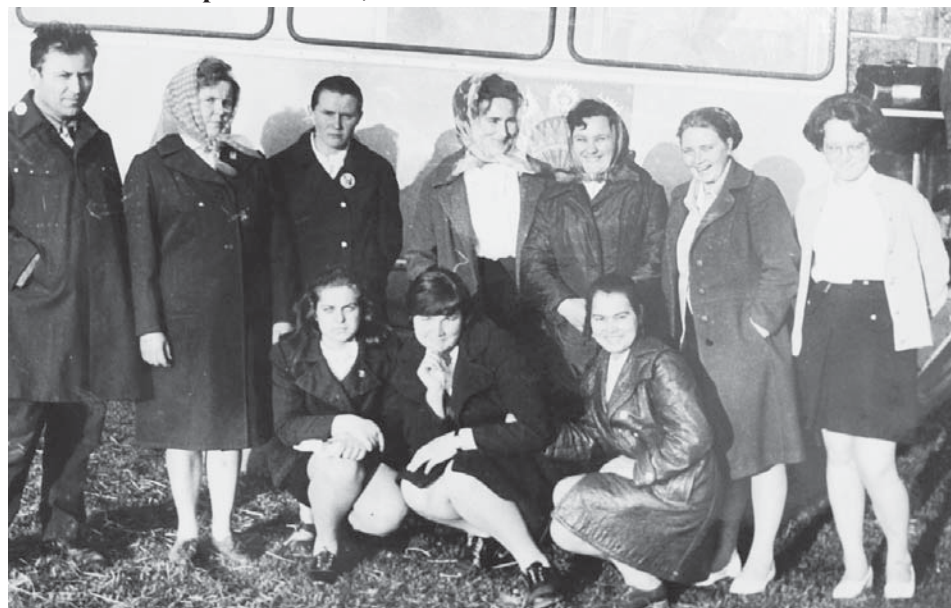
Агитбригада, 1977 год

В первый год образования района была получена самая высокая урожайность зерновых – 15,79 ц/га.