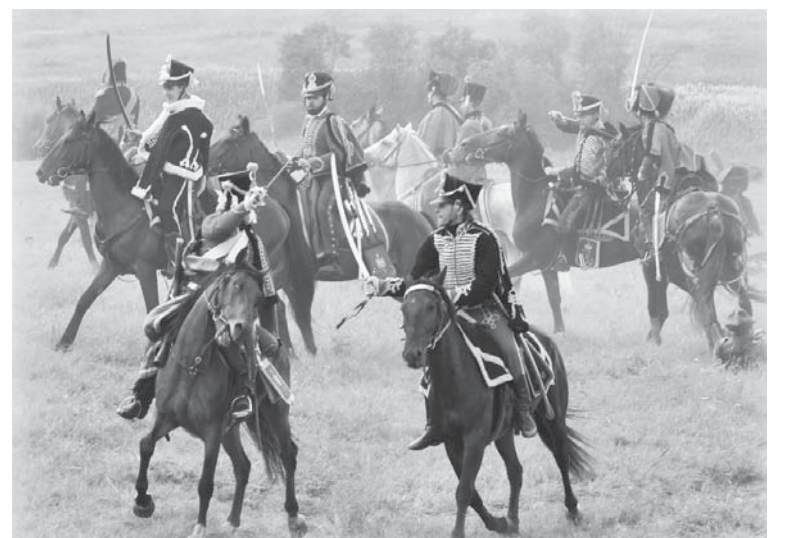
Реконструкция сражения 1812 г. при Лубино (2011 г.)

Мольковцы гордятся своей богатой историей. На территории Моль-