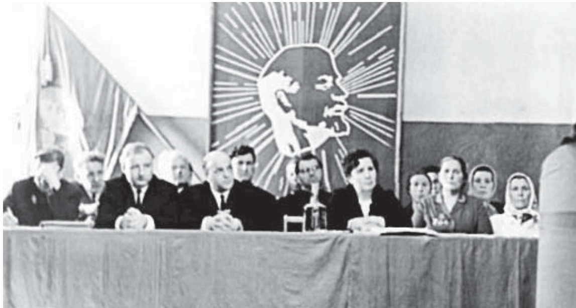
Торжественное собрание работников совхоза «Мольково»

Земли, на которых ныне располагается Кардымовский район, издревне заселены людьми. Возле деревни Мольково, на правом берегу речки Большой Вопец располагается курганная группа. В 80-х годах прошлого столетия насчитывалось 20 курганов, по свидетельствам местного населения их было значительно больше, но самые мелкие давно распаханы. Курганы разнообразны по форме и размерам. В курганах, обследованных С.П. Писаревым, обнаружены следы трупосожжения. Курганы датируются IX–XI веком нашей эры.