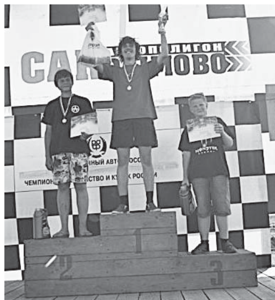
Звездный час победителей

Подготовку и проведение соревнований на автополигоне «Сар_Дымово» осуществляли Администрация Смоленской области, Администрация муниципального образования «Кардымовский район», Региональное отделение ДОСААФ России Смоленской области и Смоленское региональное отделение РАФ.