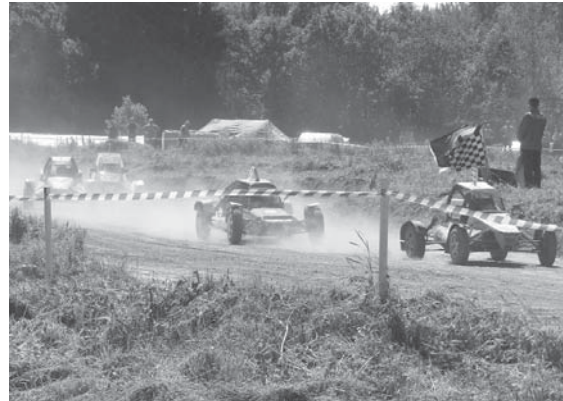
Борьба шла за доли секунды

За короткое время заброшенный аэродром для сельхозавиации недалеко от деревни Топорово приобрел новую жизнь.