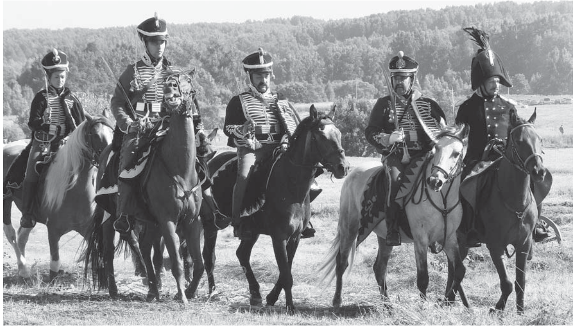
Кавалерия русской армии

Когда объявили о начале «боевых действий», все устремились по местам: кто-то занимать позицию на поле сражения, другие – места поудобнее среди зрителей. Впрочем, вторым, повезло меньше, так как всегдагдатаи реконструкции приезжают пораньше и заранее занимают места. Но чем и привлекает всех Лубино – это панорамностью. Где бы ты не