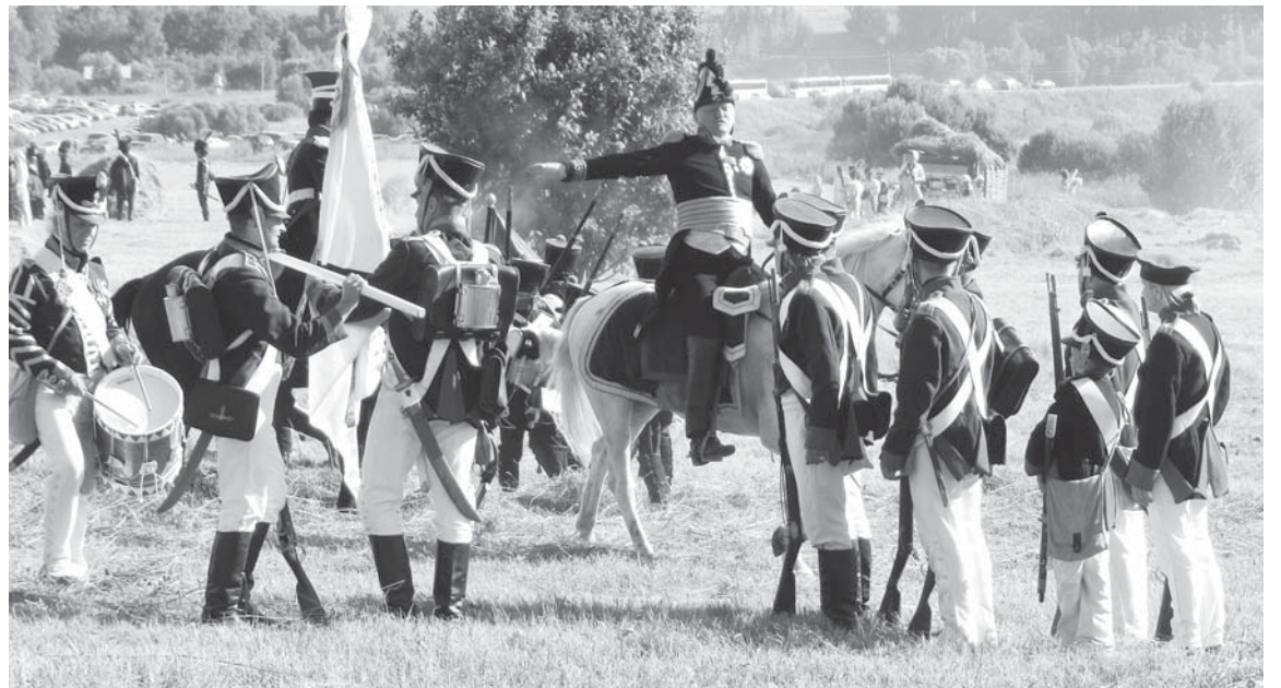
Команда: «К бою!»

Лубинское сражение среди батальонов 1812-го не самое крупное, но его значение трудно переоценить. Если бы не стратегический успех русских войск в этом сражении, позволивший сохранить армию для генеральной битвы, возможно, Бородинского сражения, просто, не было бы. После захвата Смоленска