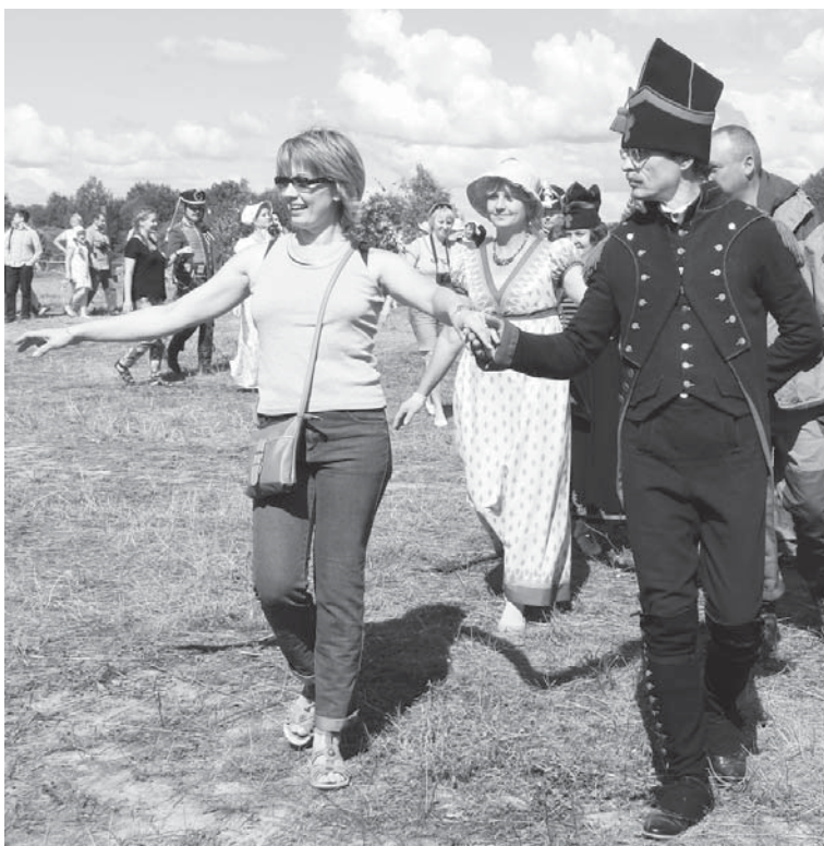
Ах, эти танцы!

В ходе программы многие зрители попробовали себя в роли артистов и с удовольствием танцевали полонез и па-де-труа прямо на траве. Солдаты 1812 года и их дамы в нарядных платьях перемешались с людьми в одежде 2013 года. Получилось очень интересная картина. И если на первый танец наши современники шли побаиваясь и стесняясь, то последующие - танцевали с удовольствием. Женщины, все же, отдавали предпочтение гусарам. (Два века прошло - пристрастия женщин все те же, а говорят, что женщины непостоянны...)