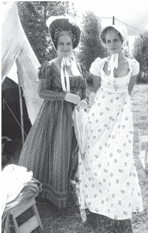
В лагере реконструкторов

В ходе программы многие зрители попробовали себя в роли артистов и с удовольствием танцевали полонез и па-де-труа прямо на траве. Солдаты 1812 года и их дамы в нарядных платьях перемешались с людьми в одежде 2013 года. Получилось очень интересная картина. И если на первый танец наши современники шли побаиваясь и стесняясь, то последующие - танцевали с удовольствием. Женщины, все же, отдавали предпочтение гусарам. (Два века прошло - пристрастия женщин все те же, а говорят, что женщины непостоянны...)