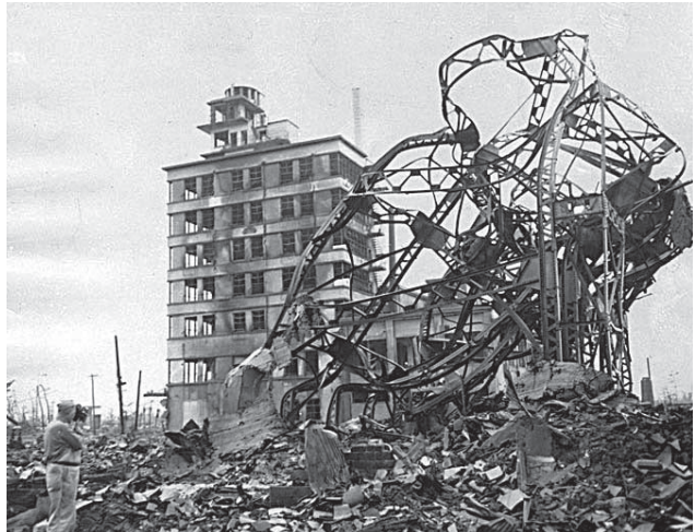
Хиросима после взрыва

Те, кто был в зданиях, как правило, избегали воздействия светового излучения от взрыва, но не взрывной волны — осколки стекла поражали большинство комнат, а все здания, кроме самых прочных, обрушивались.