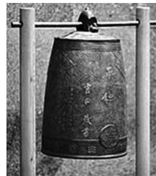
Колокол мира в Волгограде

Кацуэ Ёсида: «Внезапно произошел чудовищный взрыв, и меня бросило через дорогу на рисовое поле. Всё это произошло в один быстротечный, похожий на сон миг...»