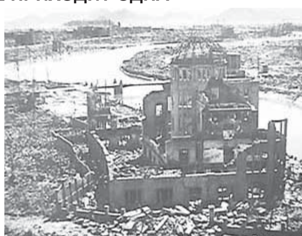
Нагасаки после взрыва

В историю эти события вошли как одни из самых беспрецедентных по жесткости, многочисленности жертв и тяжести последствий. Атомные бомбардировки на Хиросиму и Нагасаки - единственный в истории человечества пример боевого использования ядерного оружия. Жертвы этой бомбардировки продолжают умирать от лучевой болезни до сих пор, ежегодно увеличивая список жертв на 5 тысяч имен.