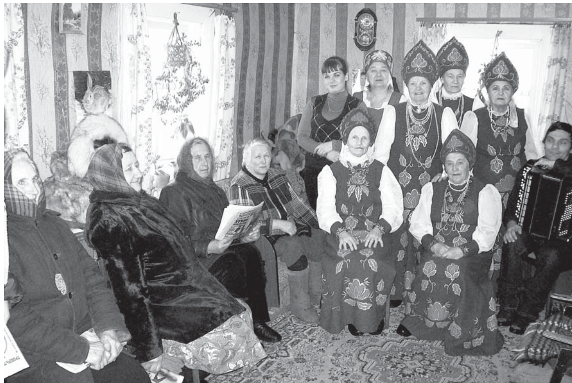
Коллектив «Надежда» в гостях у жителей д. Бельчевицы