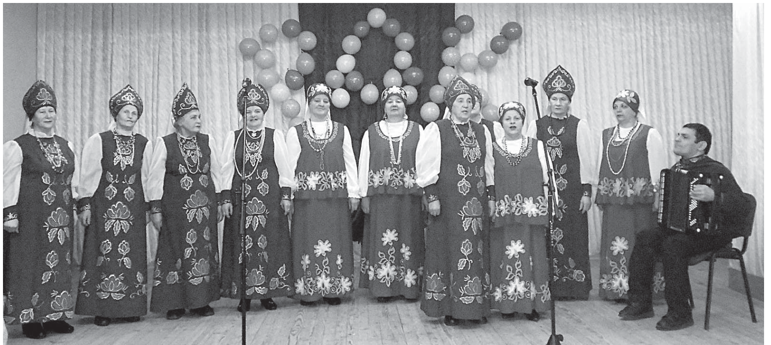
Коллектив «Надежда» - постоянный участник отчетных концертов районного Дома культуры