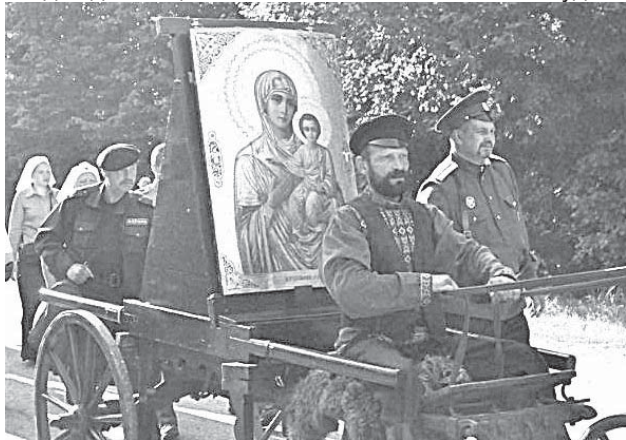
«Одигитрия» на Соловьевой переправе»

Последний день Фестиваля – подведение итогов, получение подарков, заслуженных наград. Творческую программу этого дня открыл известный на Смоленщине коллектив казацкой песни «Ермак». Продолжился день конкурсом на лучшую уху и лучшую рыбацкую байку. Авторитетное жюри с удовольствием оценивало искрометность рассказчиков и качество свежеприготовленной ухи. Завершился Фестиваль награждением делегаций и отдельных участников. Само награждение проходило в теплой дружеской обстановке. Многие за эти три дня обрели друзей, научились радоваться не только своим, но и чужим победам, едва ли не больше, чем собственным. Многие обменивались адресами и телефонами. А, уезжая, каждая делегация салютовала автомобильным гудком