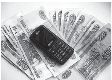
Схема действий преступников достаточно проста. Раздается звонок, звонящий представляется сотрудником полиции, объясняет ситуацию, в которую якобы попал родственник (чаще всего им является сын) и предлагает свои услуги в решении вопроса за определенную сумму. Если жертва соглашается, то деньги она должна передать курьеру, либо перечислить на какой-либо счет. Любой такой звонок - это чистой воды мошенничество. Сотрудники полиции не решают вопросы о прекращении уголовного дела, тем более за деньги. Сразу же звоните в отделение полиции.

Мошенники - хорошие психологи. Они не дают жертве опомниться, и первая ее реакция в такой стрессовый момент - любой ценой вызволить своих родственников из беды. В большинстве случаев люди становятся жертвами своей же собственной неосторожности. Если у вас раздается подобный звонок, сразу же позвоните сыну, дочери или тому, про кого сообщают звонящие. Проверьте, правда ли это. И тогда ситуация сама по себе разрядится.