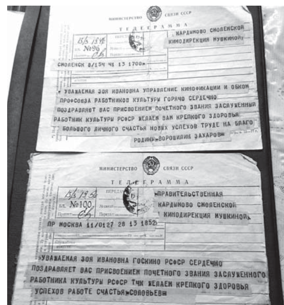
Подготовила А. ГУСЕЛЕТОВА