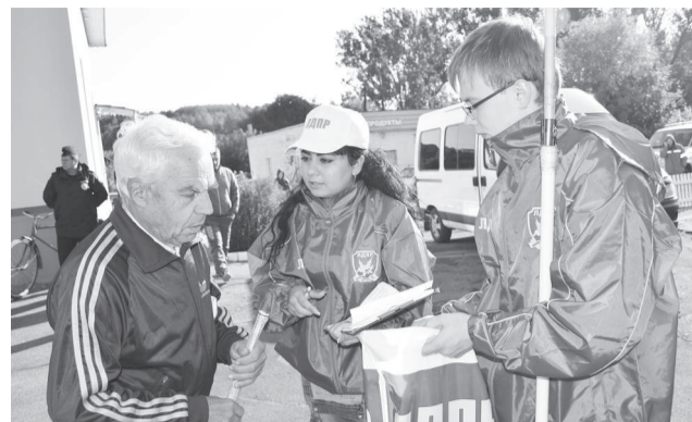
Местные жители обращаются в пункт приема заявлений (на фото Н.В. Маенков)