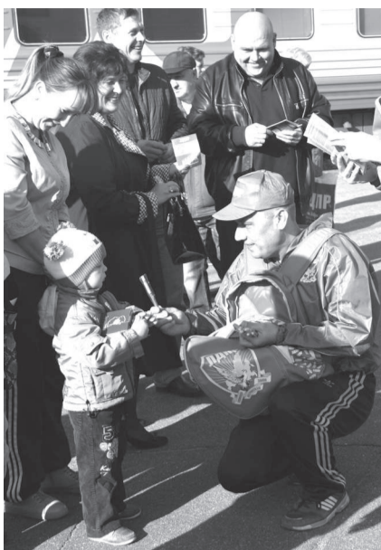
Вручение сувениров самым юным жителям

Надо заметить, что речь народных избранников была очень эмоциональной, а в своих выступлениях они критиковали федеральных чиновников, говорили о наболевшем: дорогах, медицине, образовании, сфере ЖКХ и отсутствию в стране должного к ним внимания, призывали граждан быть более активными