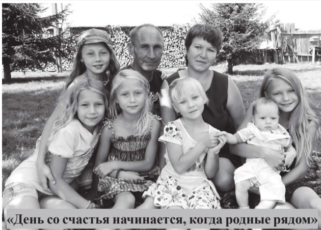
«День со счастья начинается, когда родные рядом»

Заявки на участие в семейном фотоконкурсе подали шесть кардымовских семей, каждая из которых достойна представлять район на областном уровне и достойна победы. Так, в номинации «Счастье быть матерью» участвует молодая, можно сказать в одночасье ставшая