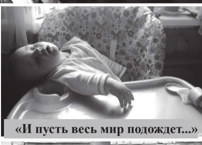
«И пусть весь мир подождет...»