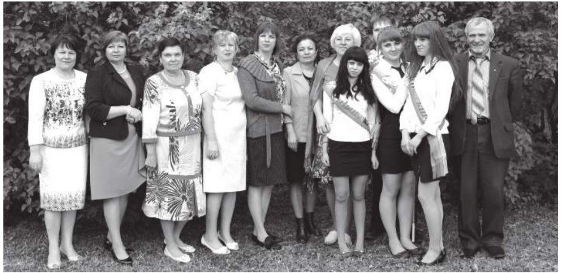
Коллектив Шокинской основной школы с выпускниками

После создания нового в те времена учреждения «Школа – детский сад» коллектив разрабатывает учебно-воспитательную систему работы в учреждении школа-детский сад (1999-2008 гг.). Причём в это же время уже велась работа над созданием воспитательной системы школы социально-нравственного становления личности. База для этой работы