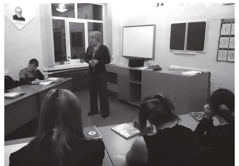
Урок в кабинете биологии

За 40 лет школа выпустила в жизнь 430 учеников. Среди учеников есть люди самых разных профессий от строителя до административного работника, учителя, медицинские работники, работники органов внутренних