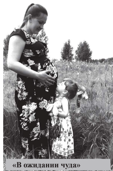
«В ожидании чуда»