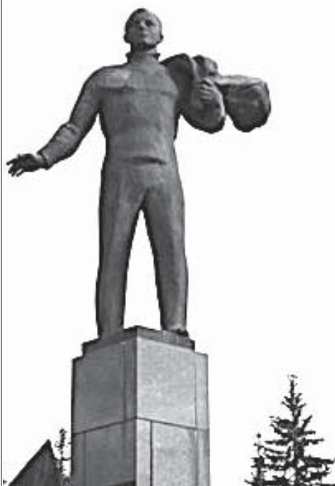
Памятник первому космонавту в г. Гагарине