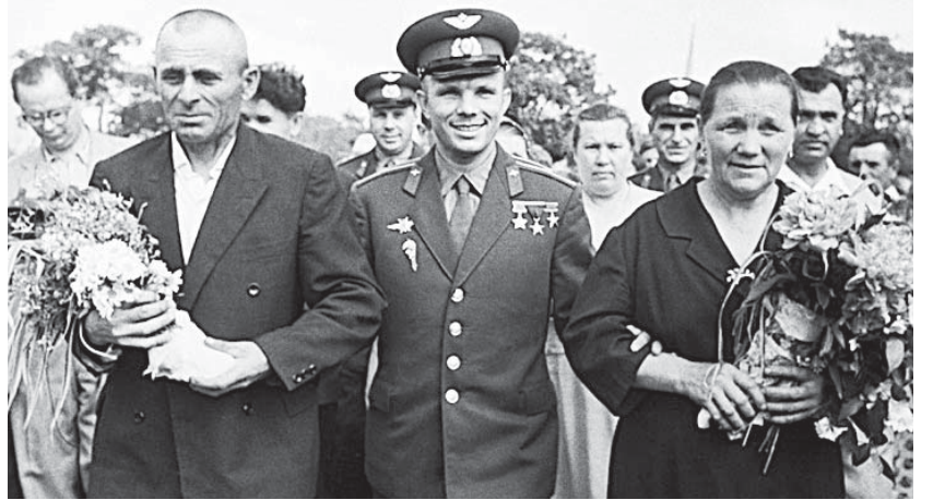
Юрий Гагарин с родителями

практически всем стало ясно, что полетит именно Гагарин. Никто из руководителей советской космической программы никогда не говорил, что Юрий Алексеевич был подготовлен лучше, чем другие. Выбор первого определялся многими факторами, причем физиологические показатели и знание техники не были доминирующими. И Сергей Павлович Королев, который внимательно следил