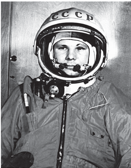
Первый космонавт планеты Земля Юрий Гагарин

Юрий Гагарин – героическая личность – тем важнее и интереснее знать путь его становления, формирования, чем он был увлечен, каким человеком был, каким он остался в памяти людей. Каким был первый космонавт планеты Земля, бесстрашный рыцарь космоса, славный сын нашей Родины, человек, подвиг и улыбка которого покорила всю нашу планету?