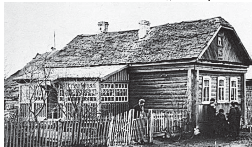
Родной дом первого космонавта, д. Клушино Смоленской области

В Советской Армии с 1955 года, поступил в 1-е военное авиационное училище летчиков имени К.Е. Ворошилова в городе Чкалове (с 1957 года и ныне Оренбург), которое окончил в 1957 году по первому разряду. Государственные экзамены по теоретическим курсам он сдал на «отлично». Служил летчиком в 769-м истребительном авиационном полку Военно-воздушных сил Северного флота (аэродром Луостари). Летал на