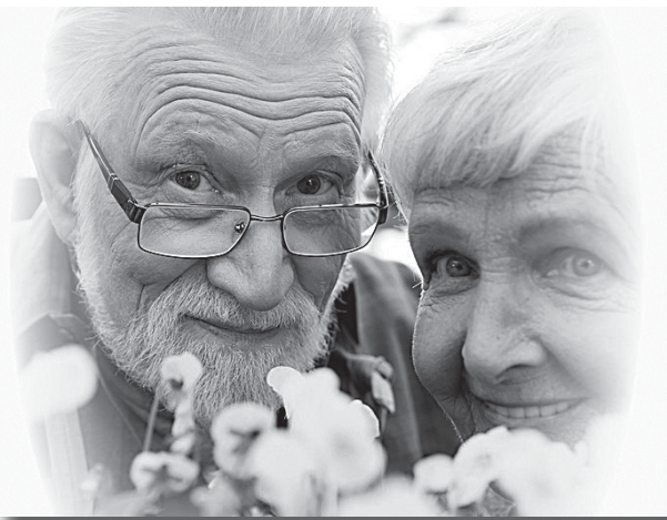
По состоянию на 1 января 2011 года численность людей преклонного возраста составляет 299 тыс. человек, в том числе 127 тыс. человек проживает в сельской местности.

лого возраста и инвалидов на протяжении двух последних лет остается стабильным: функционируют 24 стационарных учреждения социального обслуживания, где постоянно проживают более четырех тысяч престарелых граждан и инвалидов, 25 центров социального обслуживания населения, где более 10 тысяч человек ежегодно получают социальные услуги. Также ежегодно более 27