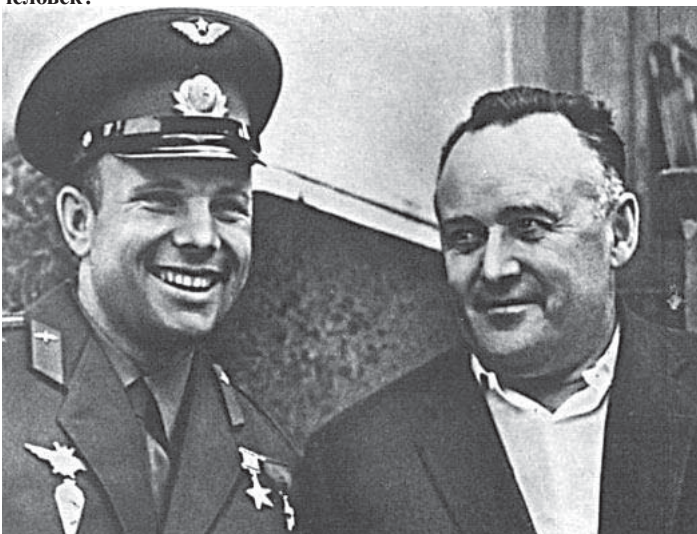
Ю.Гагарин и С.Королев