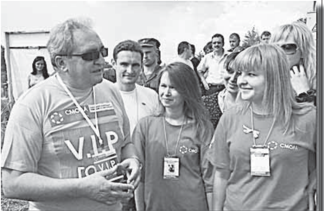
Губернатор С. Антуфьев в гостях у «СМОЛЫ»

лением. Здесь созданы условия для творческого развития и самосовершенствования молодежи. Привлекается внимание исполнительной и законодательной власти всех уровней, средств массовой информации и общественности к проблемам молодежи Смоленской области. Здесь разрабатываются предложения для региональных и муниципальных целевых программ различной направленности, которые в свою очередь способствуют самореализации молодежи.